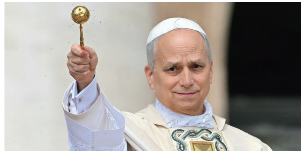
복음적 권고의 실천은 세상에 대한 거룩함의 증거다. 신자들에게 성수를 뿌리는 교황 레오 14세

따라서 하느님께서 교회의 신자들에게 바라시는 것은 신자들이 거룩한 사람이 되는 것입니다(1테살 4,3 참조). 그분께서는 세상 창조 이전에 우리를 선택하시어, 성직자나 평신도의 구분 없이 모든 신자가 거룩함으로 부름을 받았습니다(에페 1,4 참조). 이러한 거룩함은 성령께서 신자들 안에 맺어 주시는 은총의 열매를 통하여 드러날 것입니다.